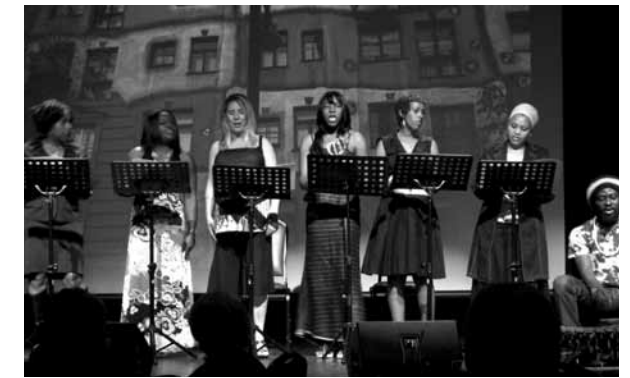
Projet de recherche-action/théâtre et lectures publiques de « Soleil Barclay »

Bulletin Bleu Trois fois par année, l'équipe de La Maison Bleue publie un bulletin informatif pour les parents du centre contenant des articles sur des thèmes de prévention et d'éducation variés : santé, éducation, sociabilité, etc. Un témoignage d'une maman de La Maison Bleue ainsi que des suggestions d'activités à faire à Montréal s'y retrouvent aussi.