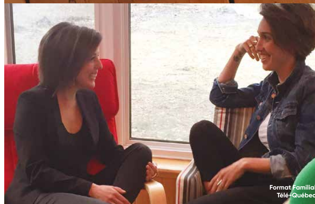
Format Familial Télé-Québec