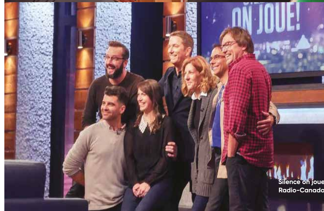
Silence on joue Radio-Canada