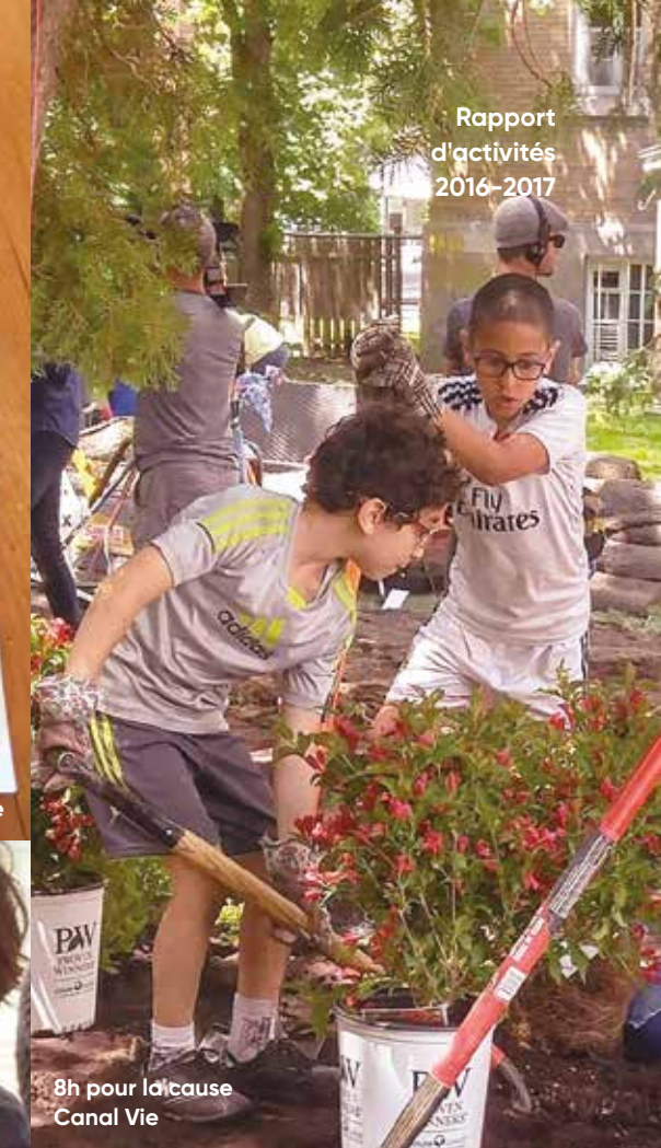
8h pour la cause Canal Vie