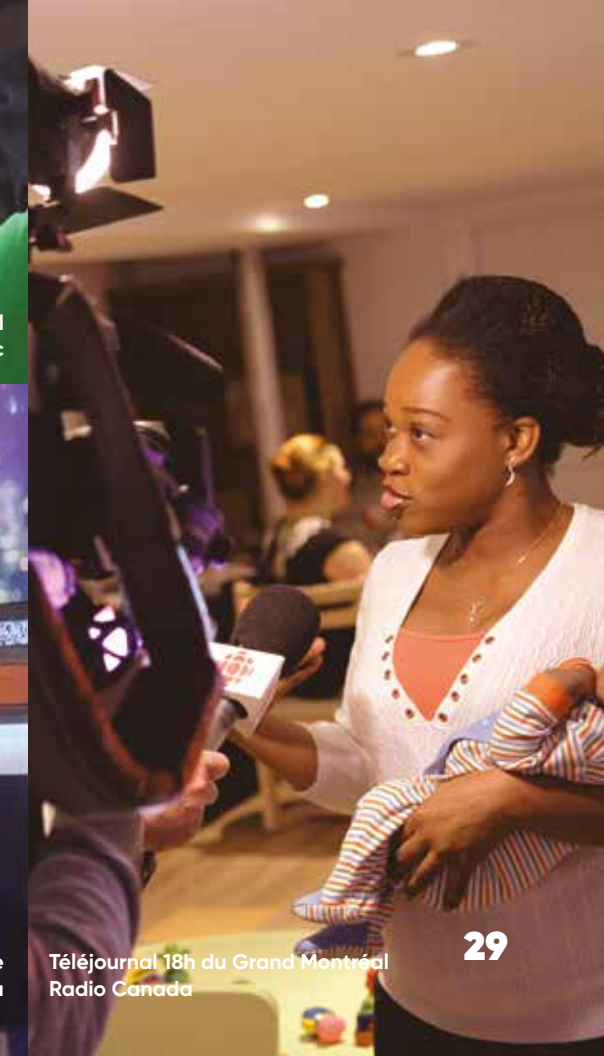
Téléjournal 18h du Grand Montréal Radio Canada